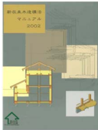
新在来木造構法 マニュアル