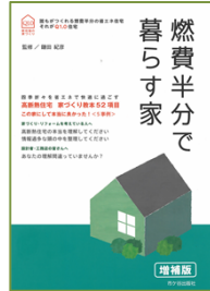
燃費半分で暮らす家