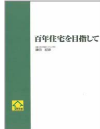
ユーザー向けコラム集 百年住宅を目指して