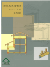
新在来木造構法 マニュアル