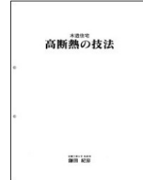
専門家向け 高断熱の技法