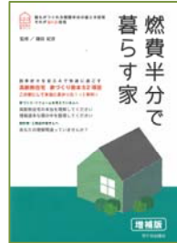
燃費半分で暮らす家