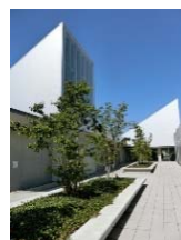
十和田市立図書館