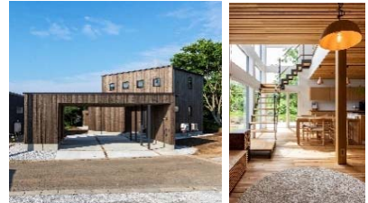
菊池組クルミの木の下の家