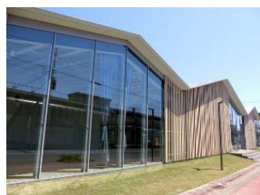
市民交流プラザワーレ