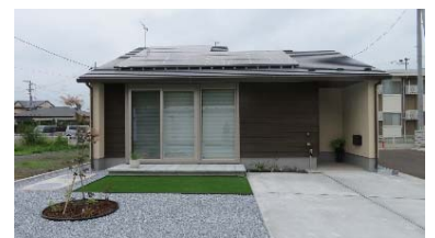
ジェイホーム展示場