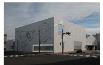
十和田市地域交流センター (とわふる)