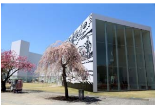
十和田市現代美術館