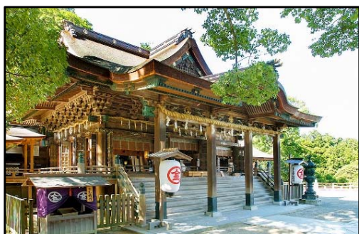
金刀比羅宮 (琴参閣から徒歩約 45 分)

「こんぴらさん」の愛称で親しまれる金刀比羅宮は、象頭山の中腹に鎮座し、海の神様、五穀豊穡・大漁祈願・商売繁盛など広範な神様として全国津々浦々より、善男善女の信仰をあつめました。参道口から御本宮までは785段、奥社までは1,368段の石段があり、参道には旧跡や文化財が多数あります。また、裏参道は、春は桜、初夏のつつじ、秋の紅葉など四季折々に変化し、悠久の時の流れは今もかわることなく、穏やかに過ぎてゆきます。