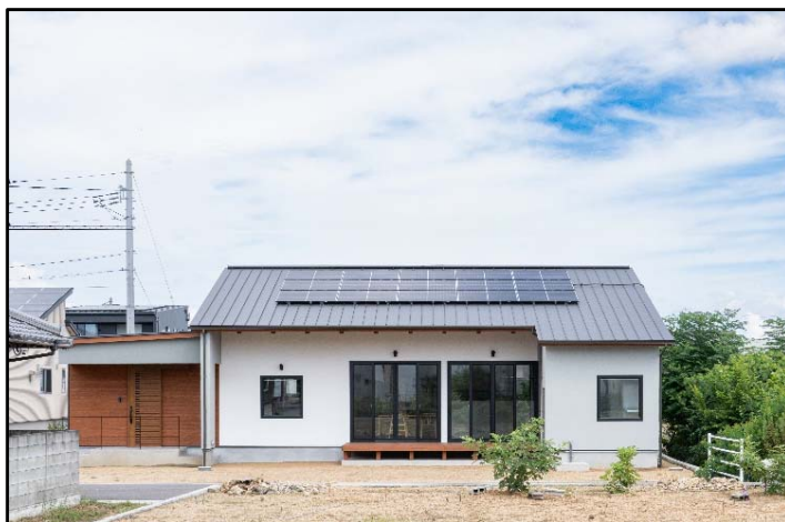
△ ハウスプロジェクト 建築事例 多肥上町の平家 (今回見学する住宅ではありません)