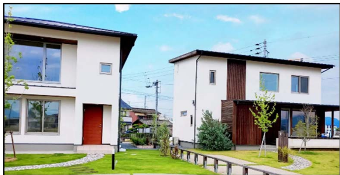
△ 大丸工業 パッシオパッシブモデルハウス